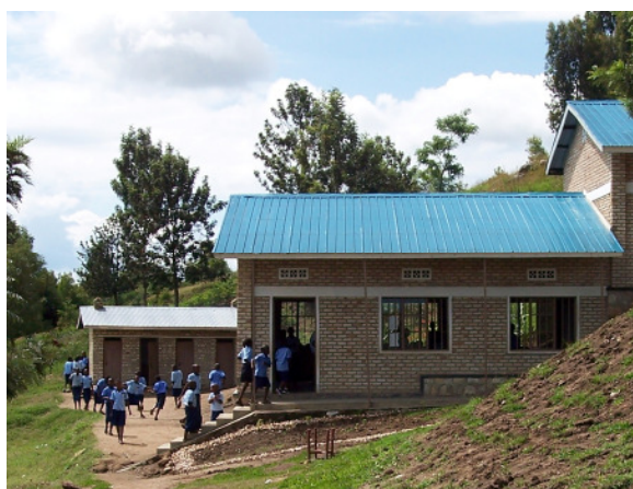
CENTRE SCOLAIRE AMIZERO B.P 30 RUHANGO RWANDA AFRIQUE