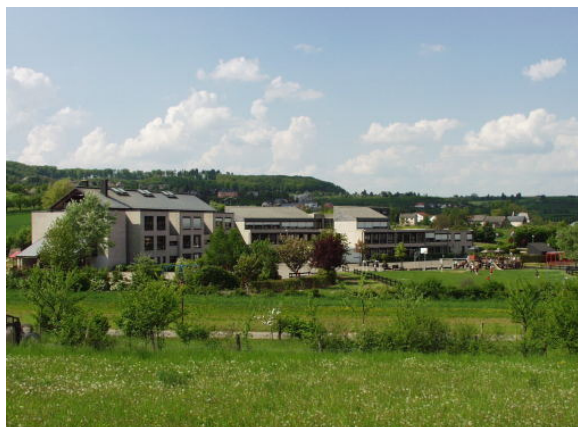
CENTRE SCOLAIRE AM SAND L-6999 OBERANVEN G.-D. LUXEMBOURG