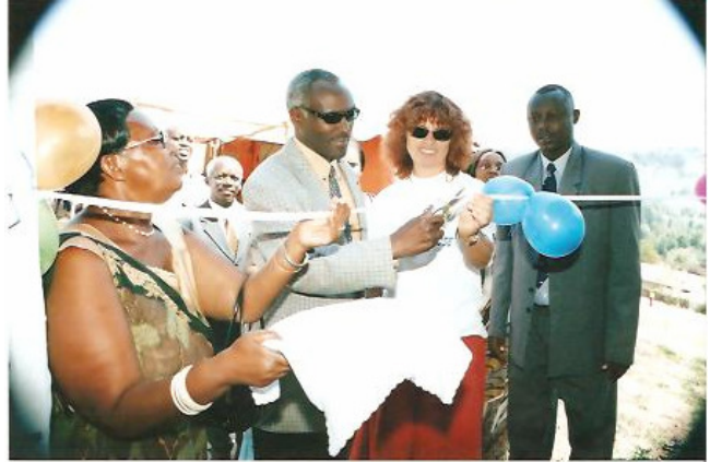
Inauguration le 21 août 2006 de 3 classes (coupure de ruban)