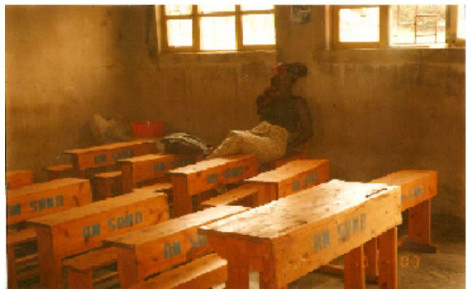
Pupitres financés par AM SAND