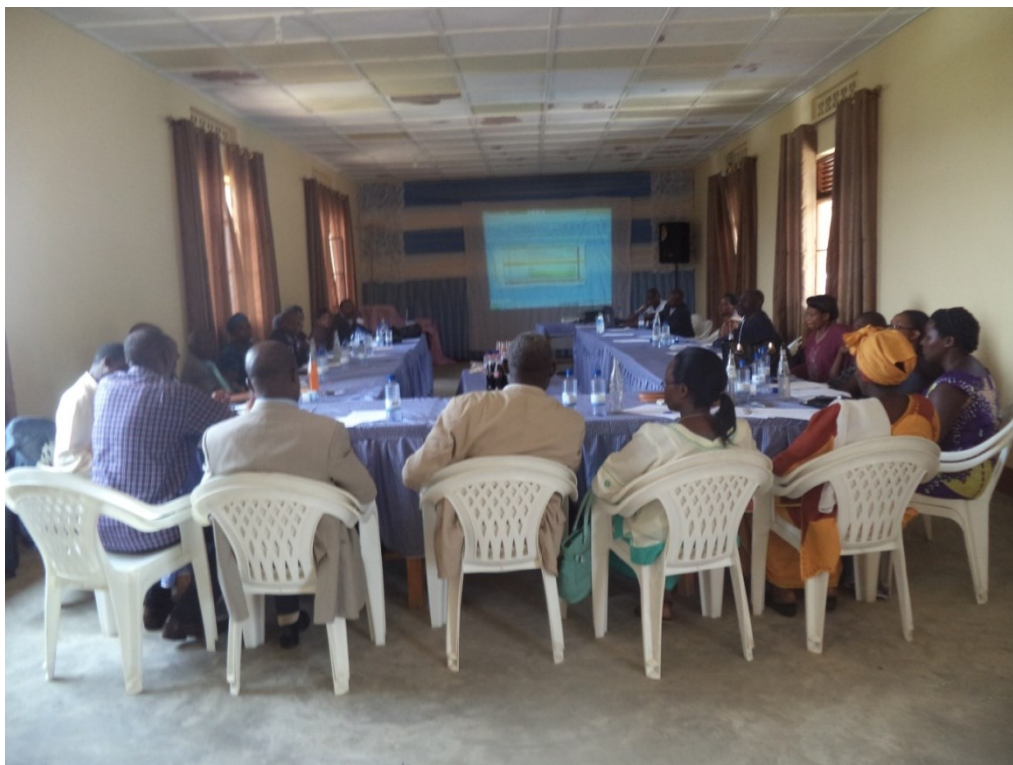
Réunion de l'assemblée générale de l'O.N.G TURERE IBIBONDO en suivant les rapports au projecteur