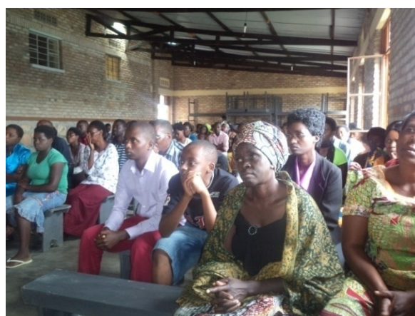
La réunion des parents qui a clôturé le premier trimestre