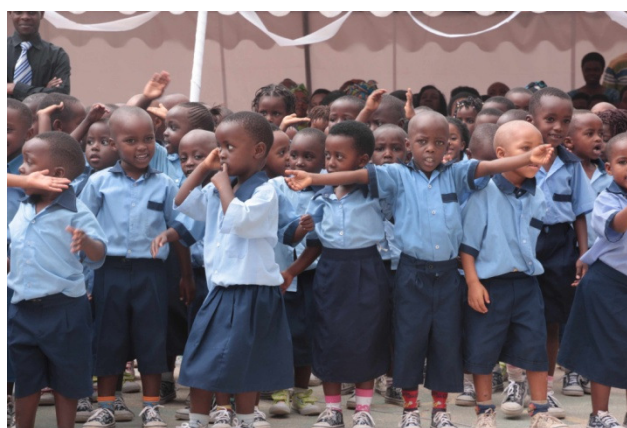
Chaussures offertes à tous les élèves par nos marraines et nos parrains comme cadeau de Noël.

Sur place, nous avons fait des activités dans les différentes classes : chansons et danses pour les petits du préscolaire, informations et photos sur le Luxembourg pour les élèves du primaire.